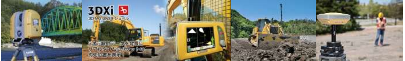
3Dレーザースキャナー